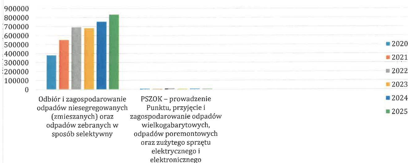
Wydatki związane z gospodarowaniem odpadami komunalnymi w latach 2020-2025